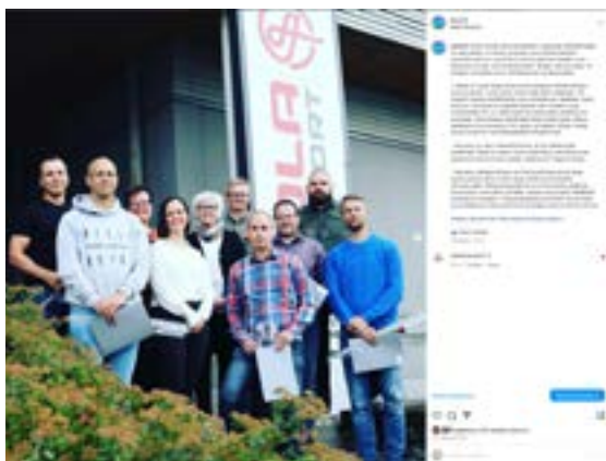
Kpedun Instagram-tili @kpedufi

LUE AJANKOHTAISET UUTISET WWW.KPEDU.FI/UUTISET