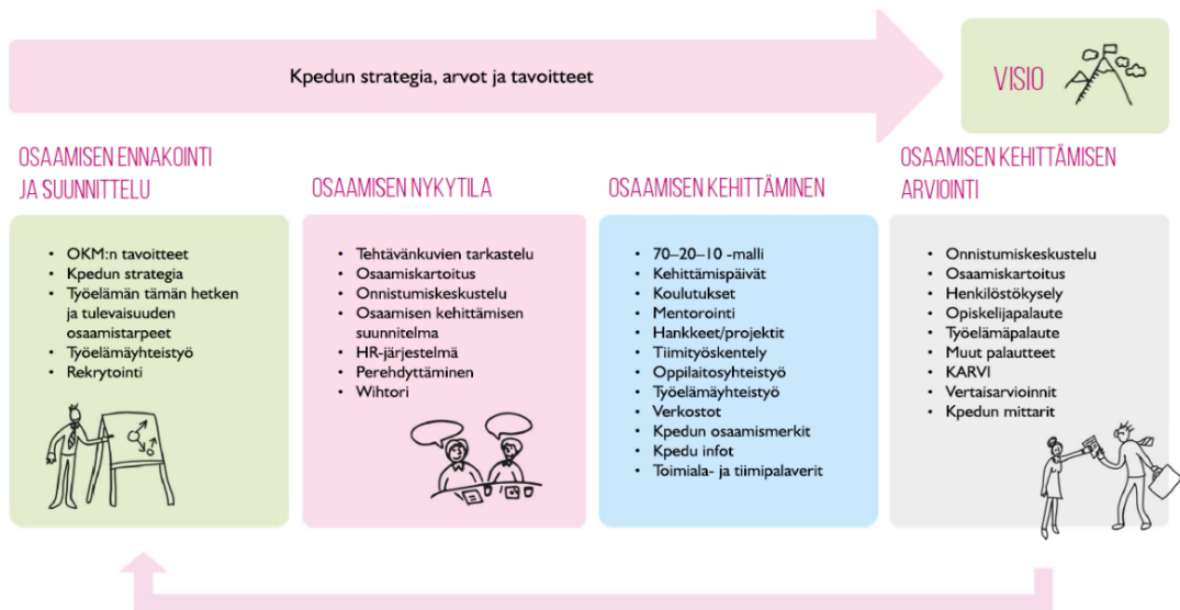
Kuva 3. Kpedun henkilöstön osaamisen kehittäminen