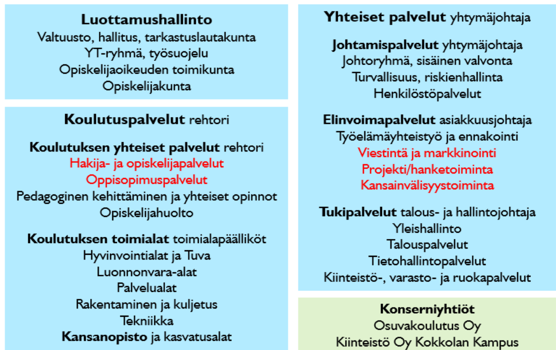
Kuva 1. Kpedun tulosyksikkötason organisaatorakenne 1.1.2026 lähtien (punaisella merkityt tulosyksiköt vaihtuneet edellisvuodesta tulosalueiden välillä)